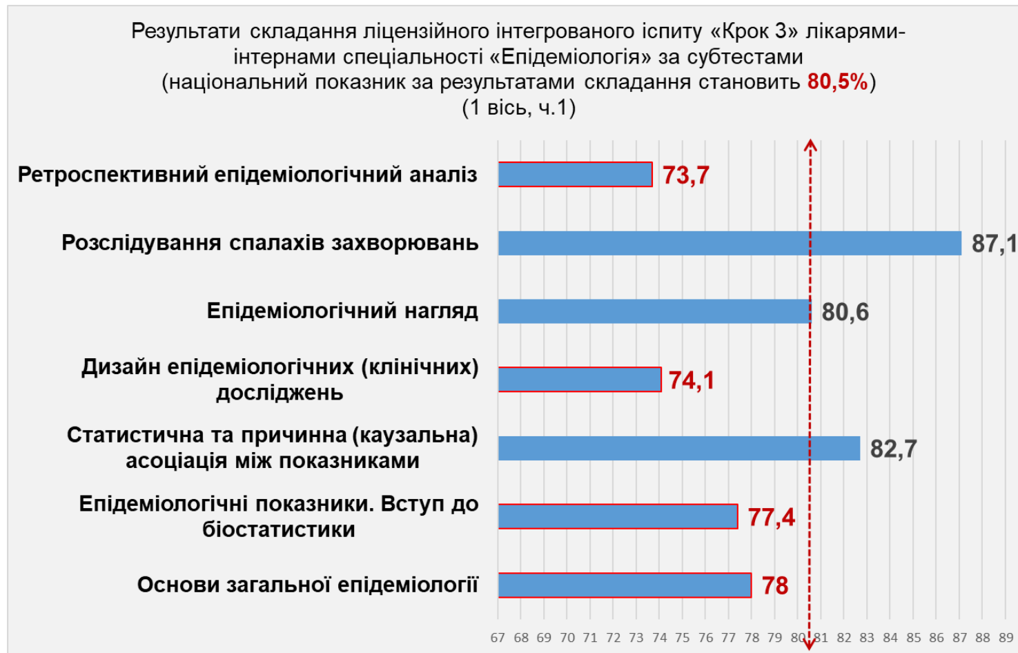
Рисунок 1. Результати складання ліцензійного іспиту «Крок 3» за субтестами .

Національний показник результатів складання ліцензійного іспиту «Крок 3» за субтестами показано в діаграмах на рисунках 1, 2