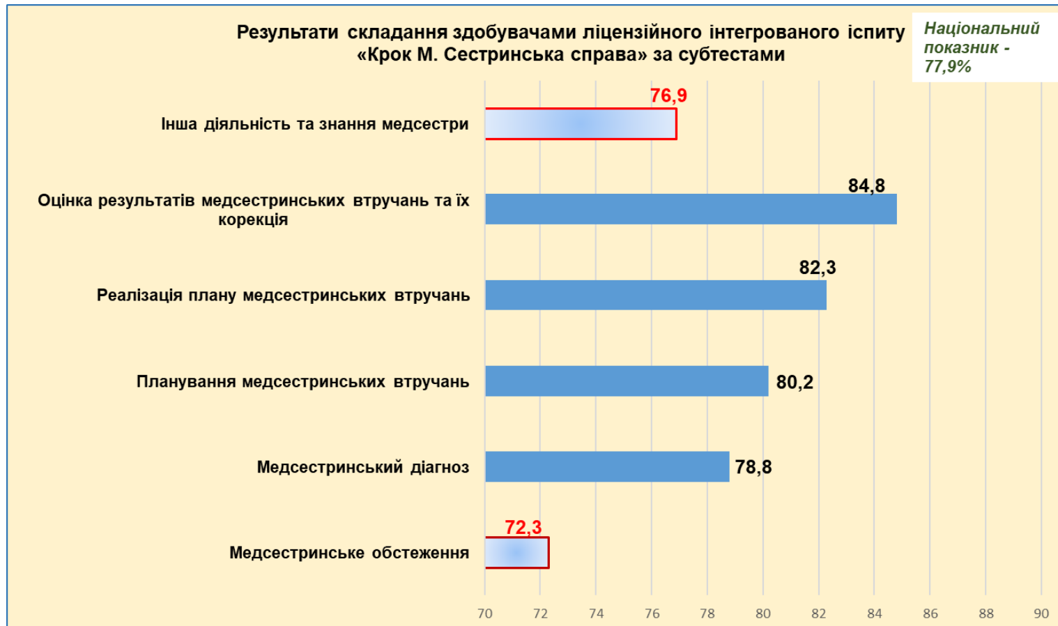
Рисунок 4. Національний показник результатів складання ліцензійного іспиту «Крок М. Сестринська справа» (вечірня форма навчання) здобувачами – громадянами України за субтестами (3 вісь) 11.01.2023

З діаграми (рисунок 4) видно, що найнижчими є показники за такими субтестами: «Медсестринське обстеження» та «Інша діяльність та знання медсестри».