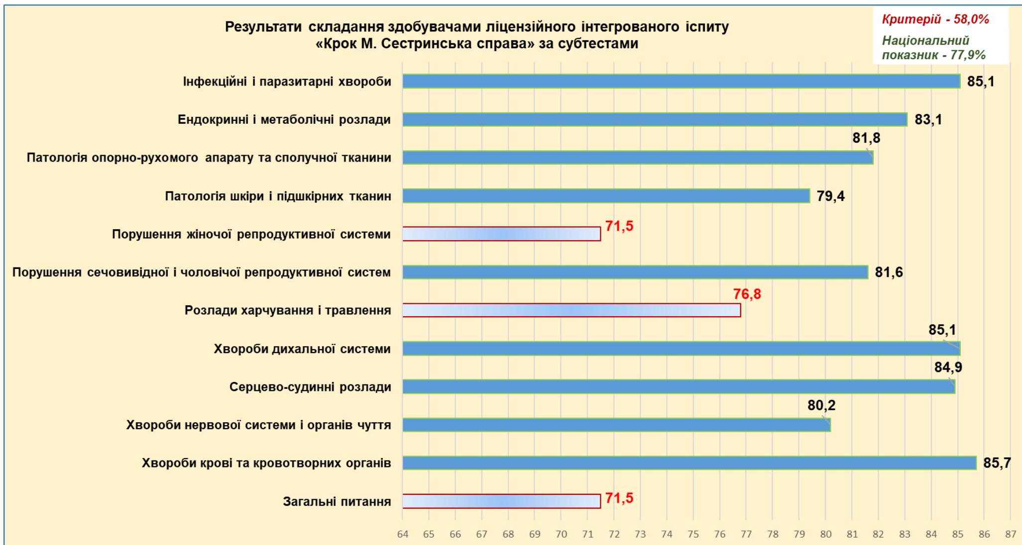
Рисунок 2. Національний показник результатів складання ліцензійного іспиту у «Крок М. Сестринська справа» (вечірня форма навчання) здобувачами – громадянами України за субтестами (1 вісь) 11.01.2023

Проаналізувавши дані з діаграми на рисунку 2, ми бачимо такі найнижчі показники за субтестами: «Загальні питання» (71,5 %), «Розлади харчування і травлення» (76,8%) та «Порушення жіночої репродуктивної системи» (71,5 %), що є нижчими за рівень національного показника – 77,9%.