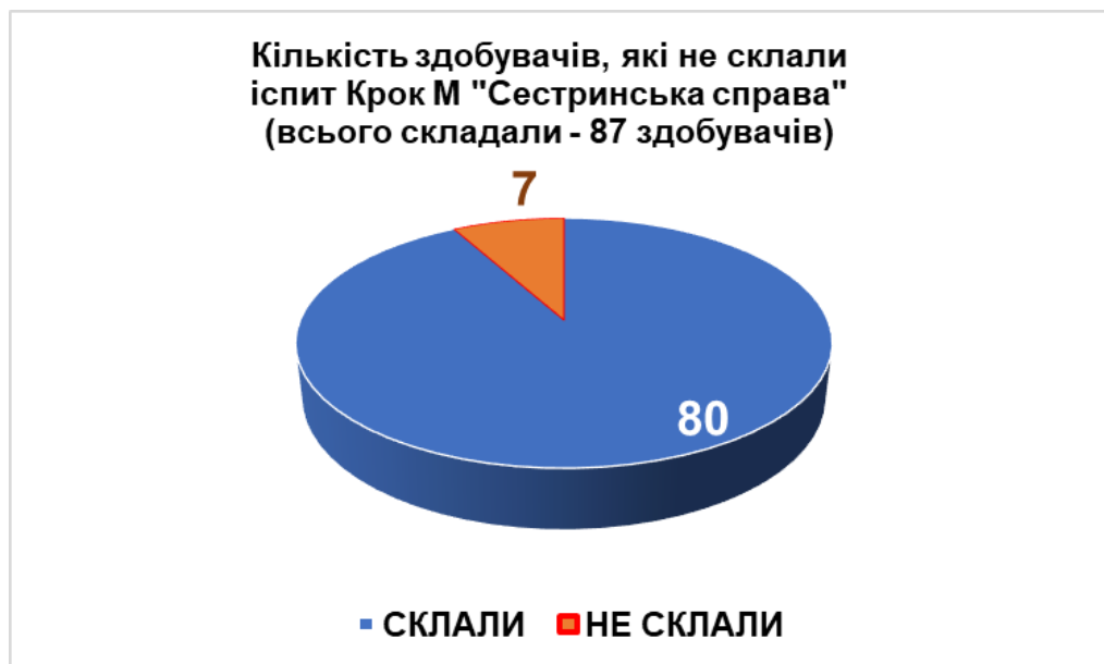
Рисунок 1. Кількість здобувачів, які не склали іспит «Крок М. Сестринська справа» (вечірня форма навчання) 11.01.2023

Як видно із таблиці 1, із 87 здобувачів, що склали цей іспит, не склали 7 здобувачів (Рисунок 1).