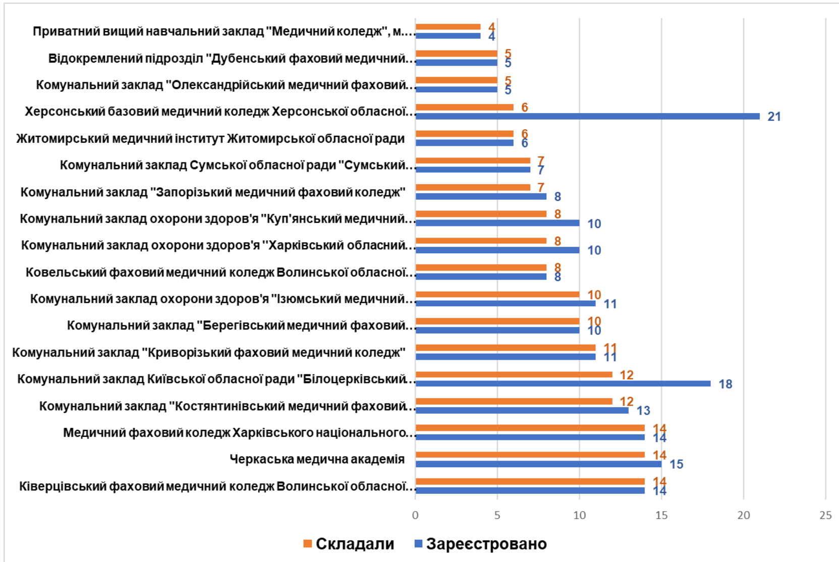
Рисунок 3. Кількість зареєстрованих здобувачів та кількість здобувачів, які брали участь в апробації ЄДКІ для спеціальності «Медсестринство»