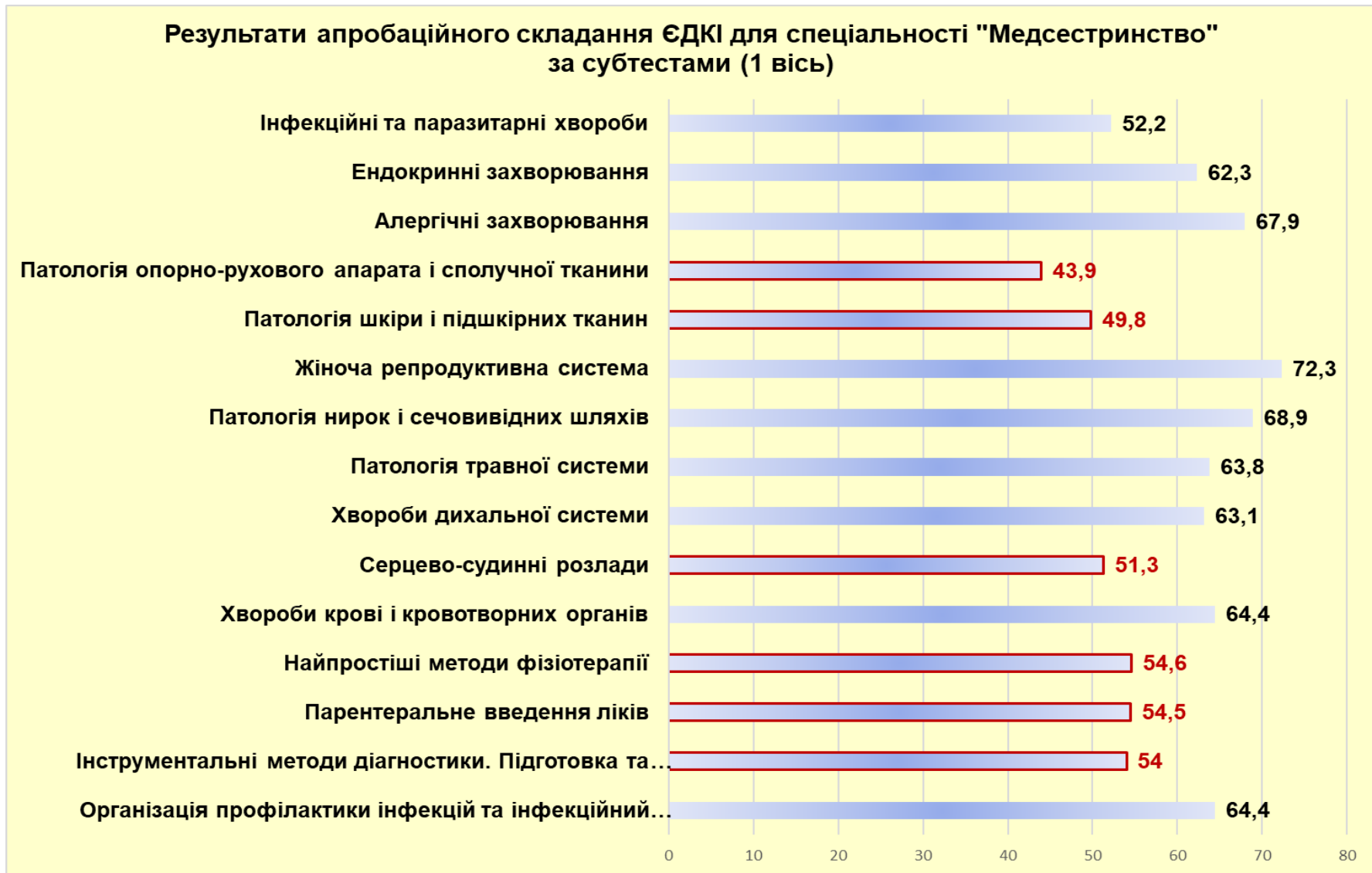
Рисунок 4. Національний показник результатів апробаційного складання ЄДКІ для спеціальності «Медсестринство» за субтестами (1 вісь)