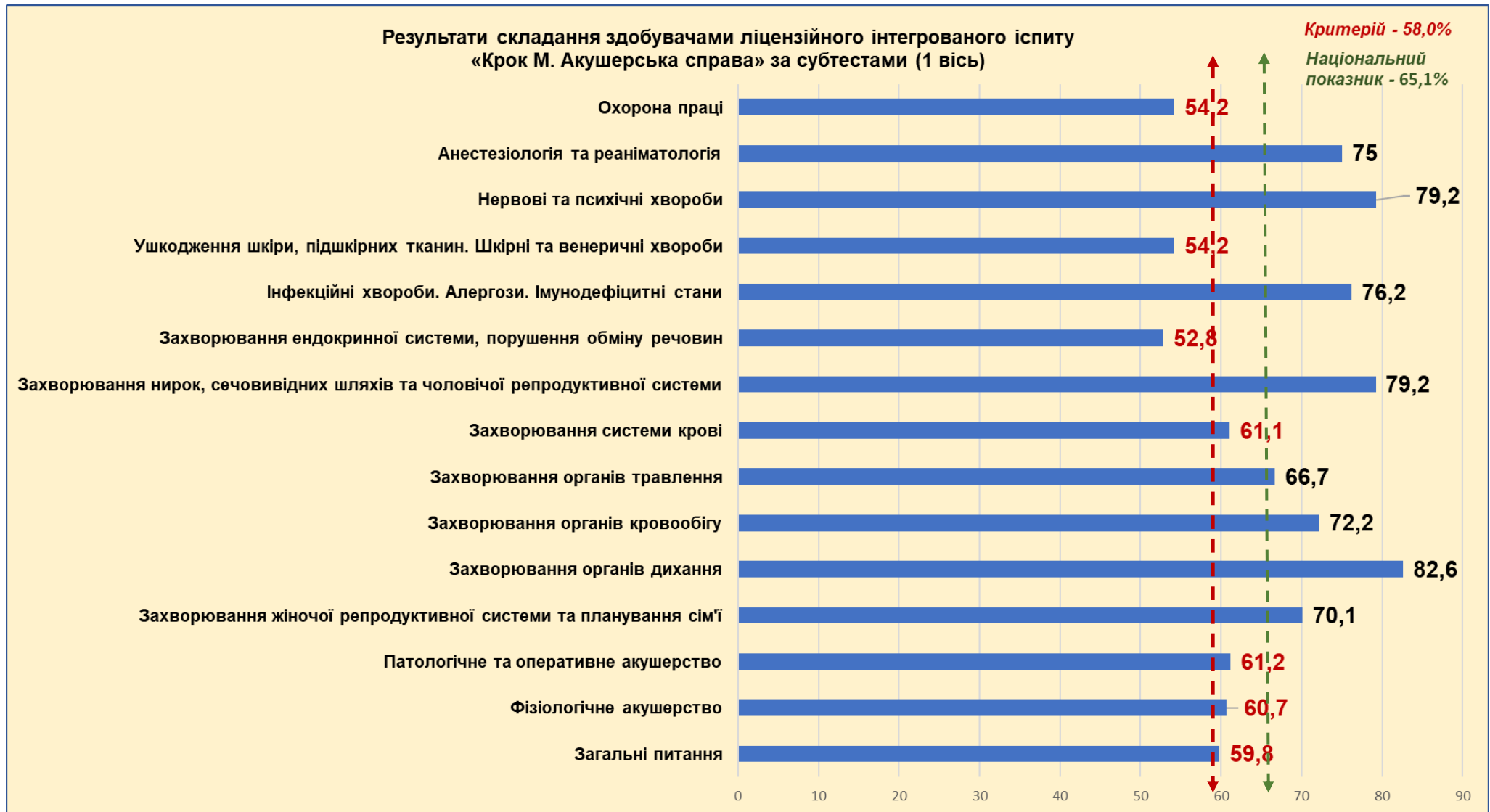
Рисунок 3. Національний показник результатів складання ліцензійного іспиту «Крок М. Акушерська справа» здобувачами - громадянами України за субтестами (1 вісь) 11.01.2023