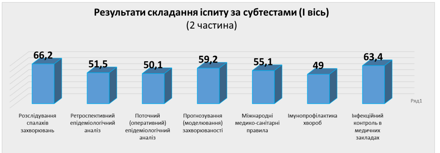
Рисунок 3. Результати складання іспиту Крок 3 за субтестами (частина 2)