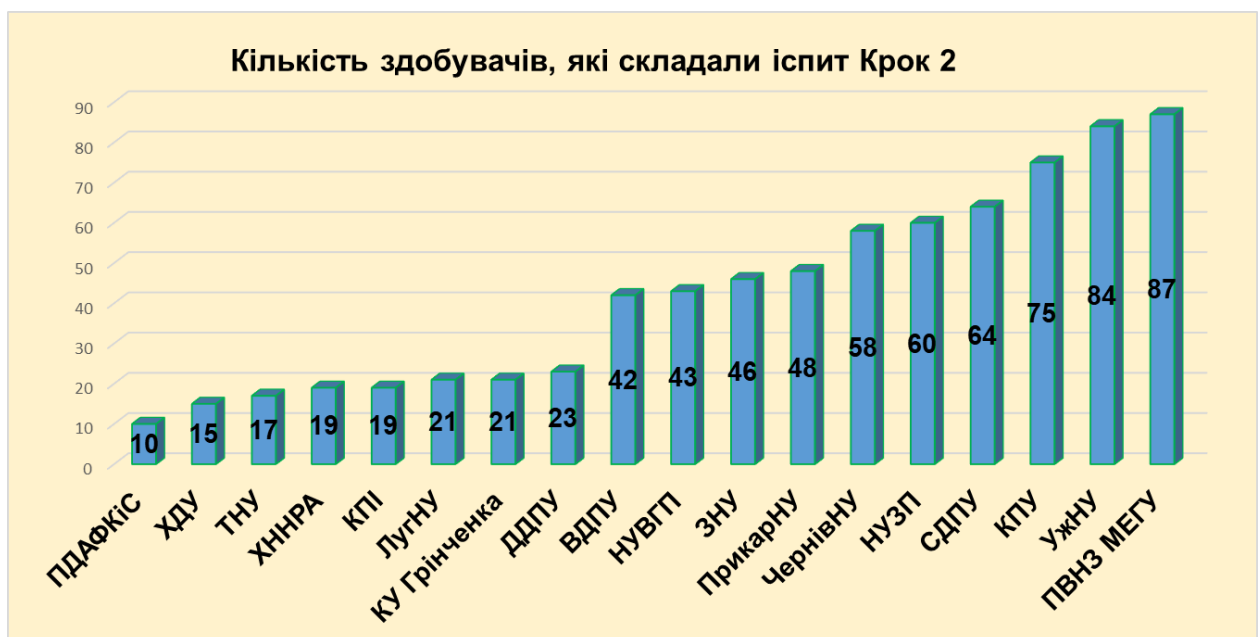
Рисунок 2. Кількість здобувачів, які брали участь в апробаційному складанні іспиту «Крок 2» в розрізі закладів освіти.

Як видно з діаграми на рис. 2 найбільша кількість здобувачів, які брали участь в апробаційному складанні іспиту була в Приватному вищому навчальному закладі “Міжнародний економіко-гуманітарний університет імені академіка Степана Дем'янчука” (87 здобувачів), найменша – у Вищому навчальному закладі “Університет економіки та права Придніпровська державна академія фізичної культури і спорту (10 здобувачів).