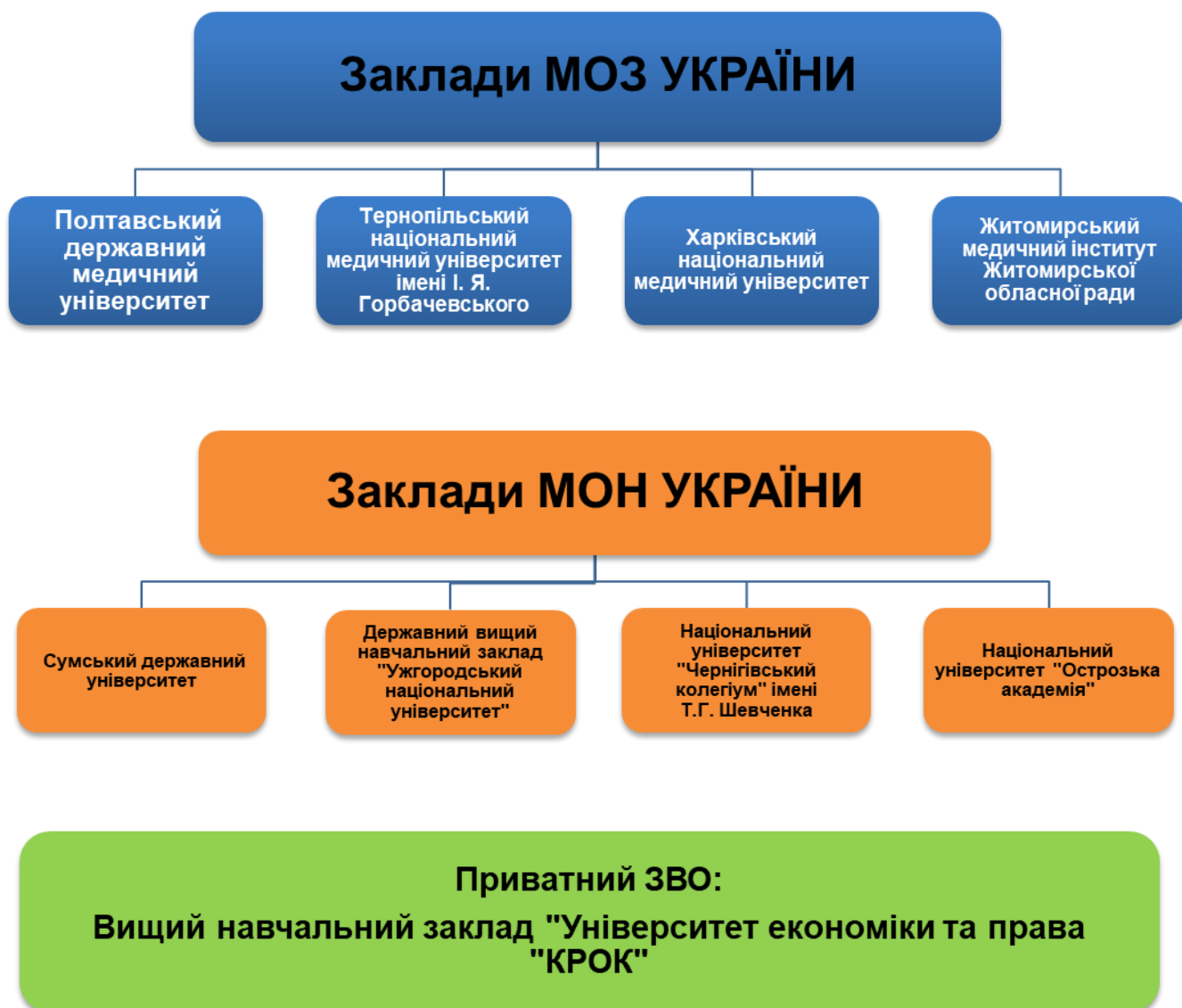
Рисунок 2. Кількість закладів освіти, які брали участь в апробаційному складанні іспиту в розрізі форм підпорядкування

Дату проведення іспитів затверджено наказом Міністерства охорони здоров'я України від 13.09.2022 № 1655.