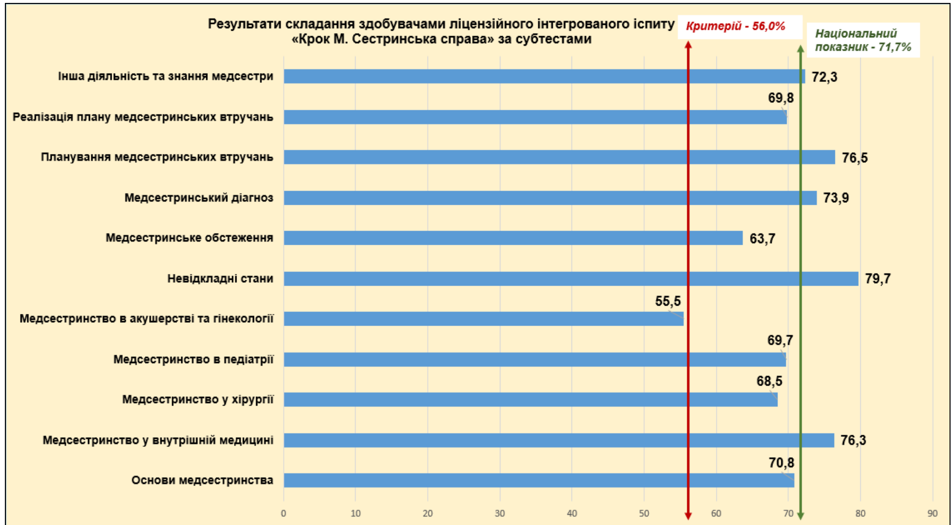
Рисунок 2. Національний показник результатів складання ліцензійного іспиту «Крок М. Сестринська справа» (вечірня форма навчання) здобувачами – громадянами України за субтестами 11.01.2022