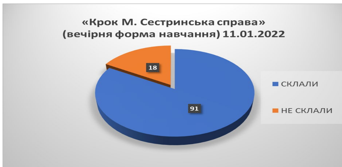
Рисунок 1. Кількість здобувачів, які склали та не склали іспит «Крок М. Сестринська справа» (вечірня форма навчання 11.01.2022)

Як видно з діаграми, із 109 здобувачів – громадян України, що склали цей іспит, не склали 18 здобувачів (Рисунок 1).