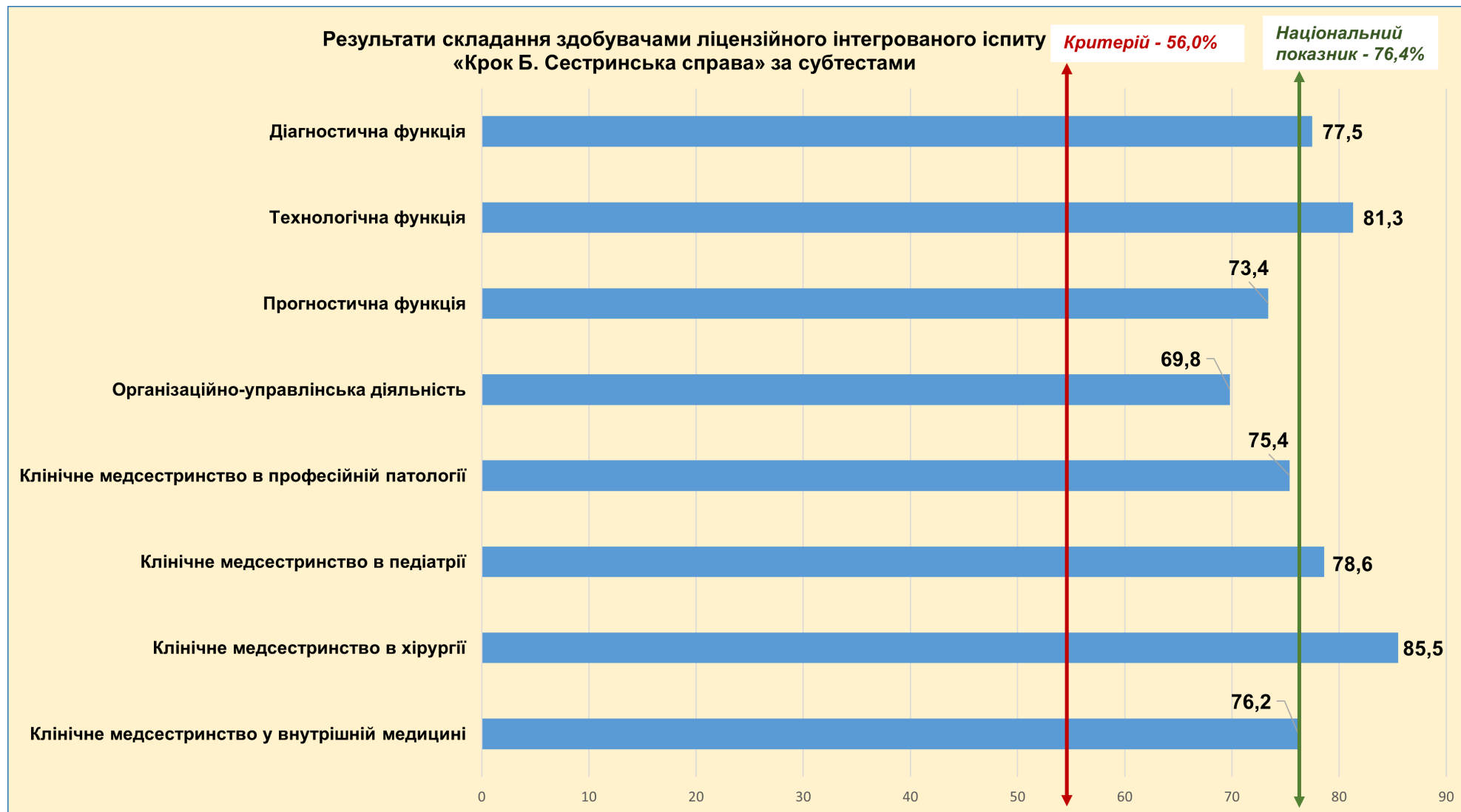
Рисунок 3. Національний показник результатів складання ліцензійного іспиту «Крок Б. Сестринська справа» (вечірня форма навчання) здобувачами – громадянами України за субтестами 11.01.2022