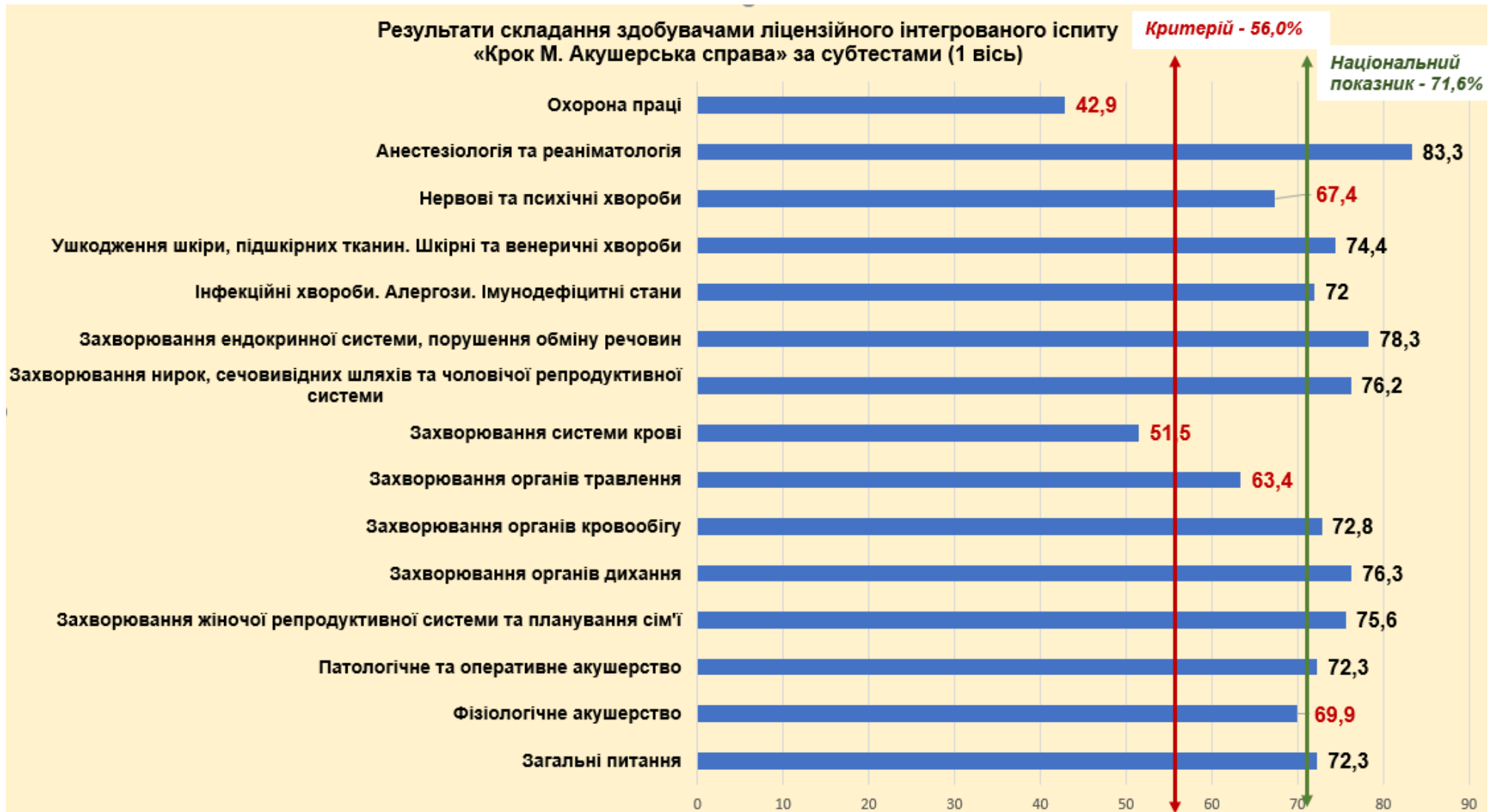
Рисунок 3. Національний показник результатів складання ліцензійного іспиту у «Крок М. Акушерська справа» здобувачами - громадянами України за субтестами (1 вісь) 11.01.2022