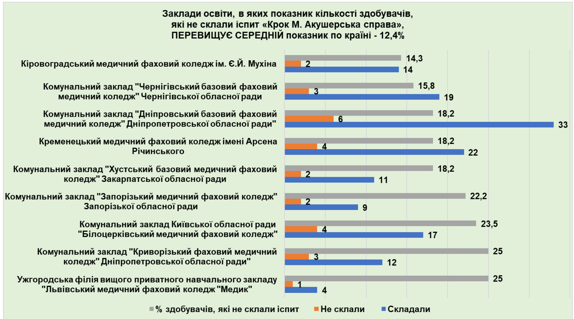
Рисунок 2.1. Діаграма «Заклади освіти, в яких показник кількості здобувачів, які не склали іспит «Крок М. Акушерська справа» перевищує середній показник по країні – 12,4 %.