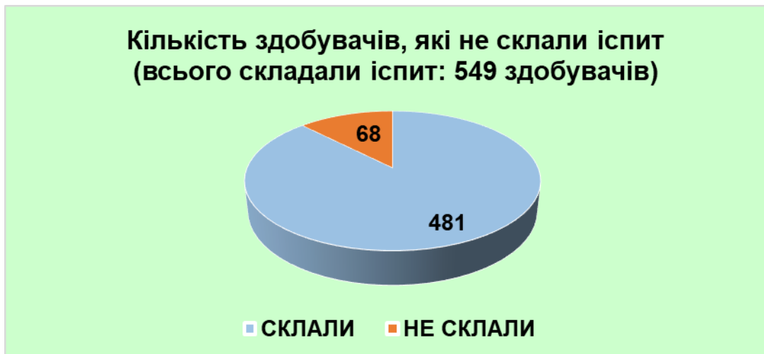
Рисунок 1. Результати складання здобувачами іспиту «Крок М. Акушерська справа» 11.01.2022

2. Іспит не склали 68 (12,4%) здобувачів, з яких 35 (8,7%) бюджетної та 33 (22,4%) контрактної форм навчання.