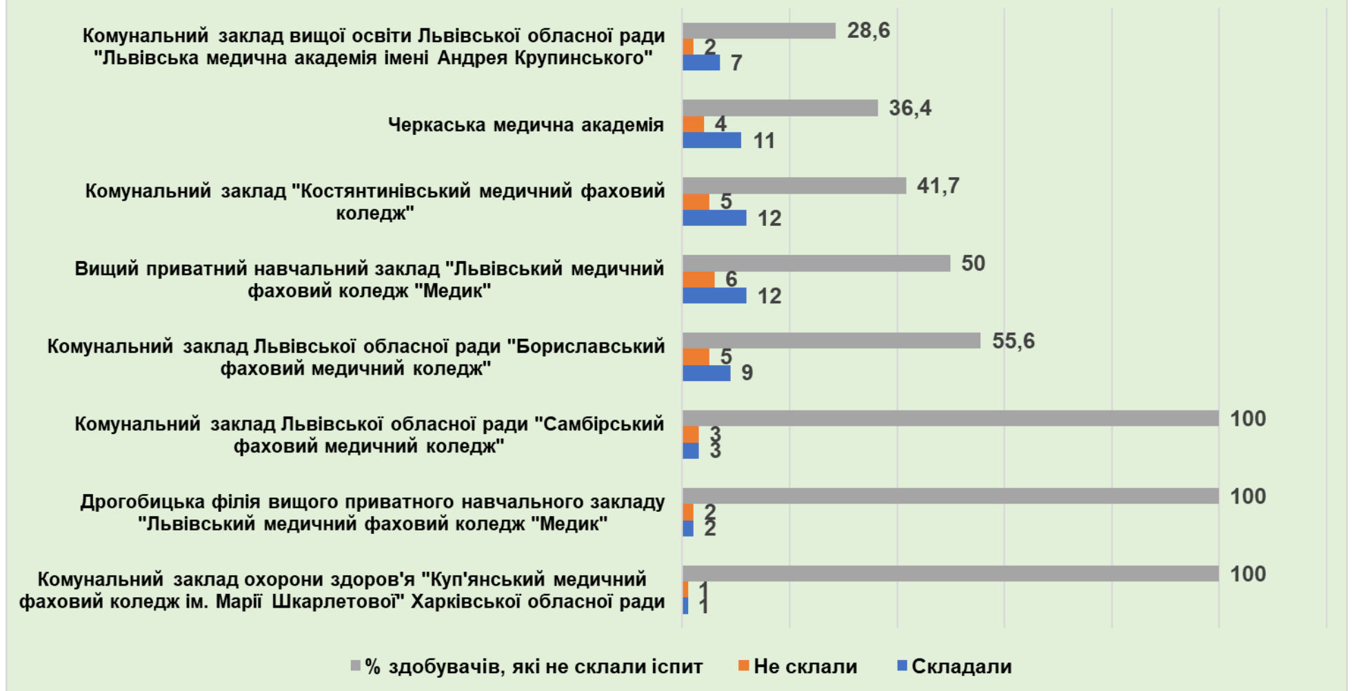
Рисунок 2. Діаграма «Заклади освіти, в яких показник кількості здобувачів, які не склали іспит «Крок М. Акушерська справа» перевищує середній показник по країні – 12,4 %.