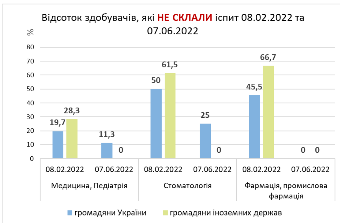
Відсоток здобувачів, які склали та не склали іспит 08.02.2022 та 07.06.2022