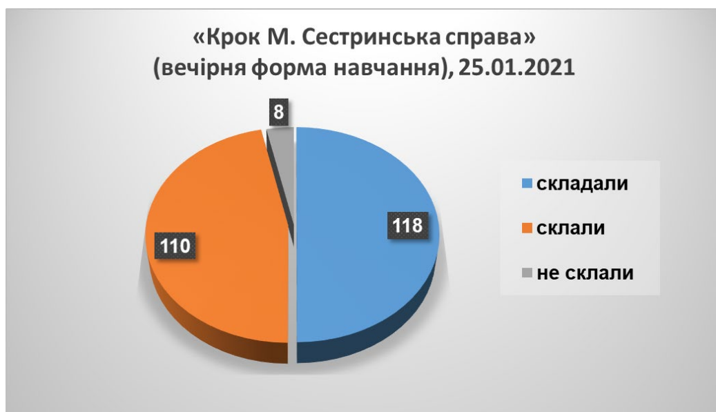
Рисунок 1. Діаграма «Кількість здобувачів, які склали та не склали іспит «Крок М. Сестринська справа» 25.01.2021.

Як видно з діаграми, із 118 здобувачів - громадян України, що склали цей іспит, іспит не склали 8 здобувачів (див. Рис. 1).