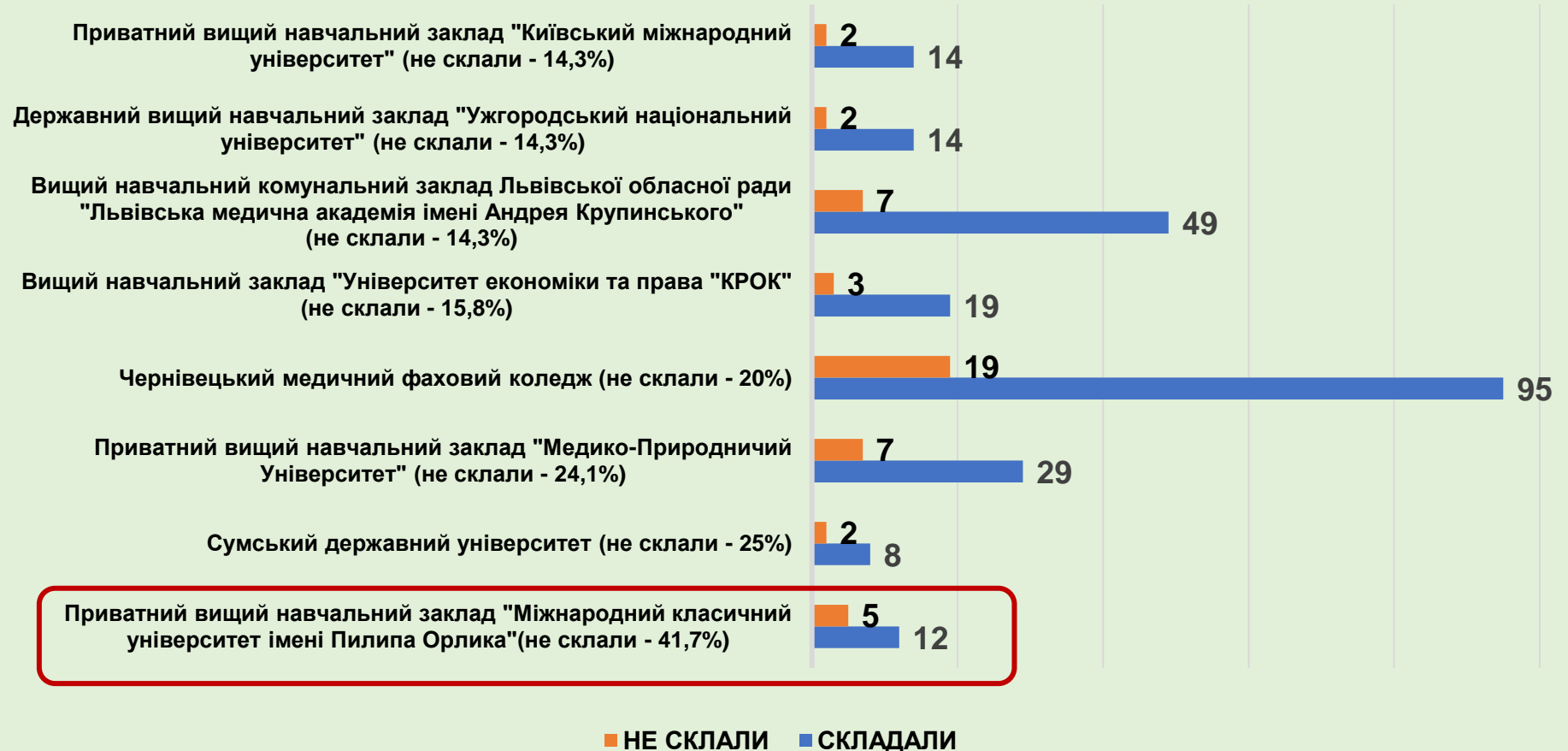
Рисунок 3. Діаграма «Заклади освіти, в яких показник кількості здобувачів, які не склали іспит Крок Б. Сестринська справа перевищує середній показник по країні - 11,2%»