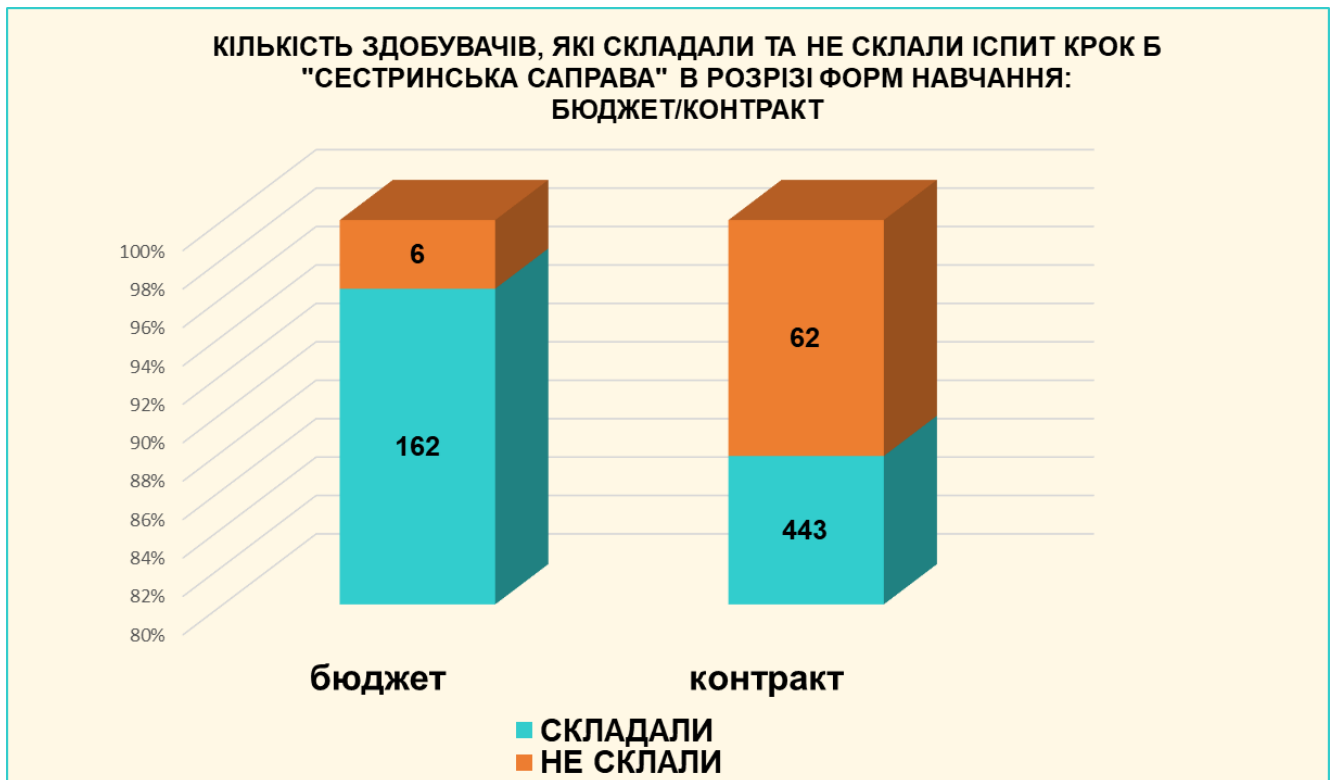
Рисунок 1. Кількість здобувачів - громадян України, які склали та не склали іспит «Крок 2» в розрізі форм навчання: бюджет/контракт.

2. Іспит «Крок Б» не склали 68 (11,2%) здобувачів, з яких 6 (3,7%) бюджетної та 62 (14,0%) контрактної форм навчання (рисунок 1).