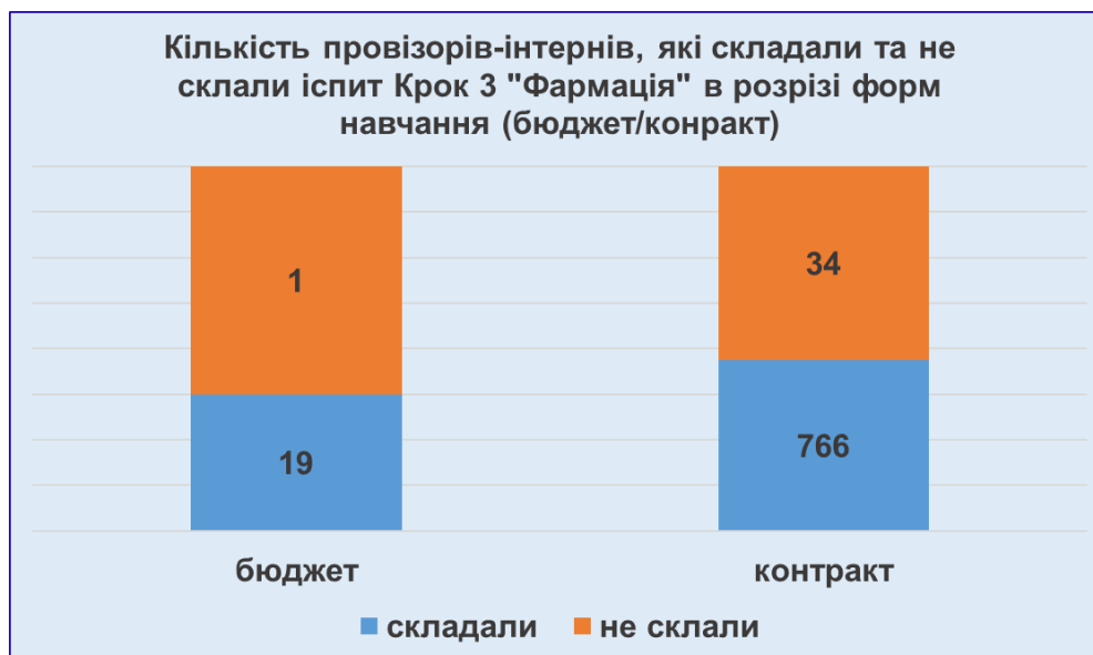
Рисунок 1. Кількість провізорів - інтернів, які склали та не склали іспит «Крок 3» в розрізі форм навчання: бюджет/контракт.

Всього по Україні 14 червня 2021 року іспит «Крок 3. Фармація» не склали 35 (4,5%) провізорів-інтернів, з яких 1 (5,3%) бюджетної та 34 (4,4%) контрактної форм навчання (Рис. 1).