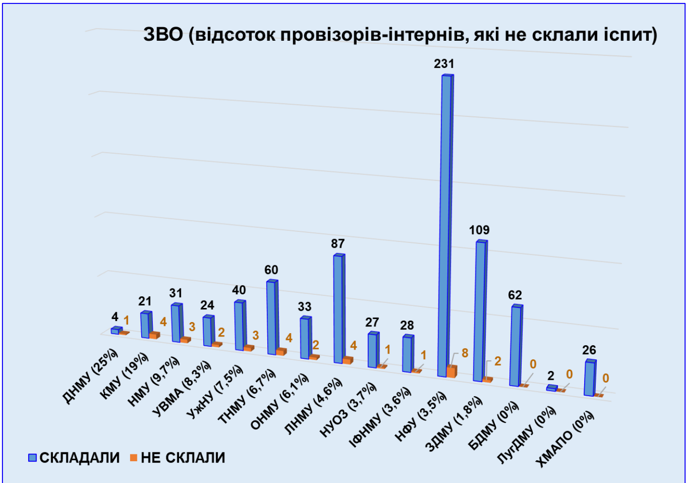
Рисунок 4. Результати складання провізорами-інтернами іспиту у 2021 році, у розрізі закладів освіти з відсотком провізорів-інтернів, які не склали іспит.

Як видно з діаграми з 15 ЗВО, що брали участь у тестуванні, у 8 ЗВО показник кількості провізорів-інтернів, які не склали іспит, перевищує середній по країні показник.