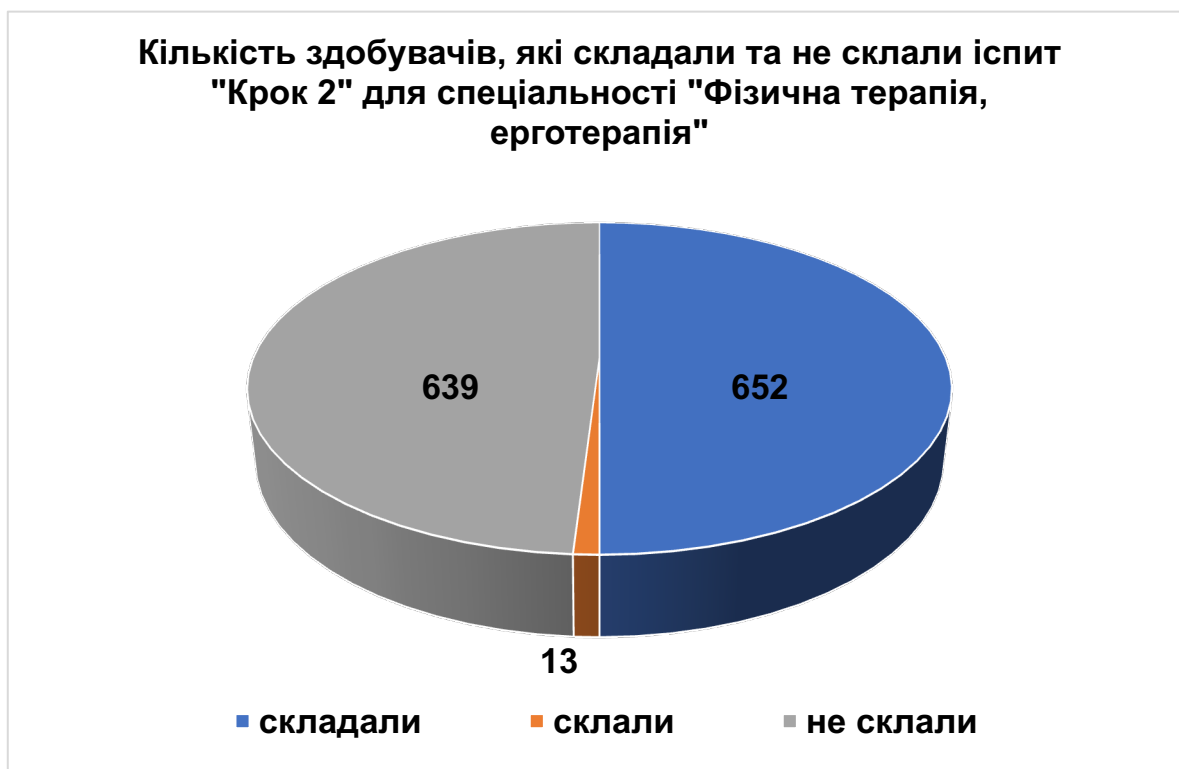
Рисунок 1. Кількість здобувачів, які не склали іспит «Крок 2» 07.12.2021

Іспит «Крок 2» не складали 15 здобувачів, з яких 9 були відсутні на іспиті з поважної (документально підтвердженої) причини, 1 знаходився у академічній відпустці та 5 було відраховано із ЗВО.