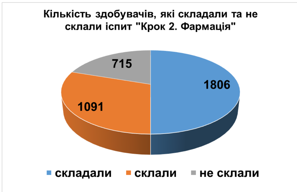
Рисунок 1. Кількість здобувачів-громадян України, які склали та не склали іспит "Крок 2. Фармація"

Іспит «Крок 2» не склали 715 здобувачів ( 714 контрактної форми навчання та 1 здобувач бюджетної (Рисунок 1)