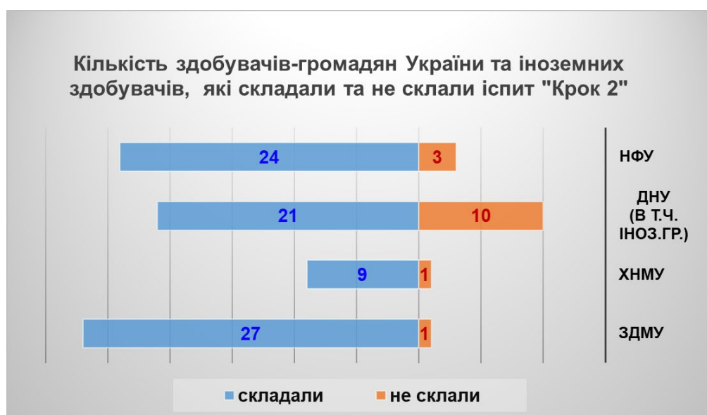
Рисунок 1. Кількість здобувачів-громадян України та іноземних здобувачів, які склали та не склали іспит "Крок 2"