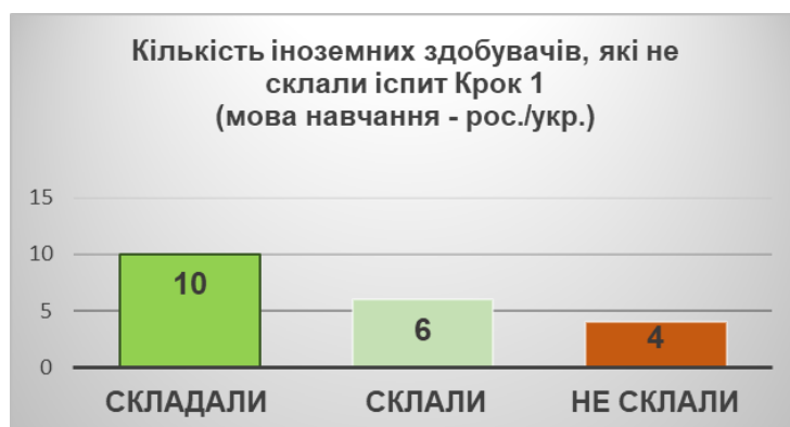
Рисунок 1. Діаграма «Кількість здобувачів, які склали та не склали іспит «Крок 1», 09.02.2021 (мова навчання – російська/українська)

Серед іноземних здобувачів, які навчаються російською/українською мовами – 4 (40,0%) здобувачі (рисунок 1).