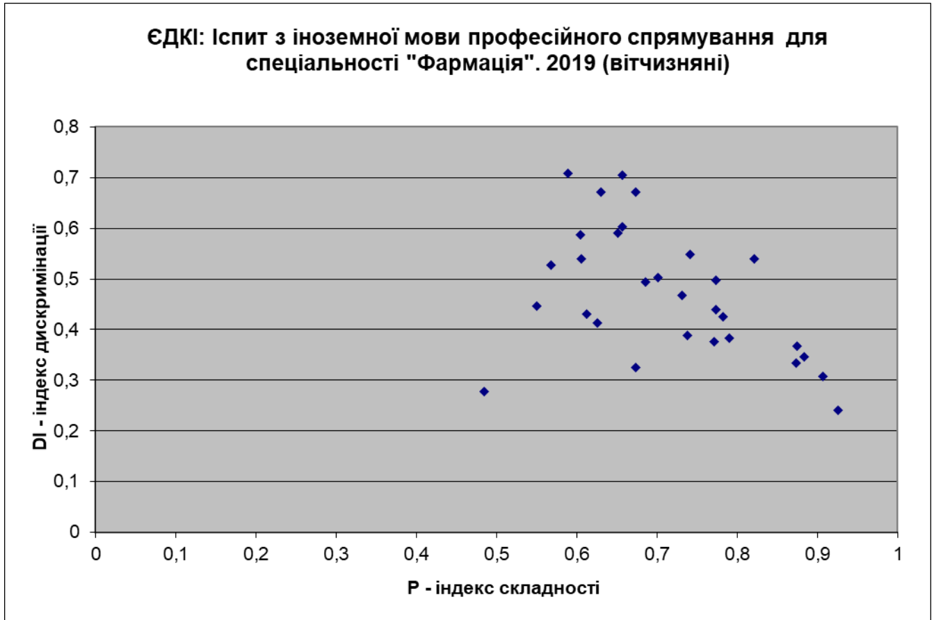
Рисунок 2. Діаграма психометрії тестових завдань іспиту з іноземної мови професійного спрямування